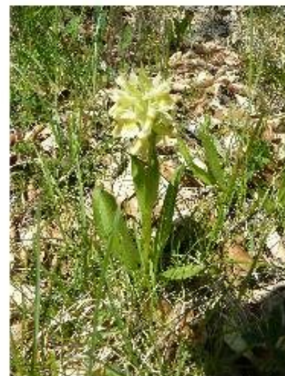
Orchis sureau - Dactylorhiza sambucina

Le genévrier et l'aubépine prennent le pas sur la végétation herbacée et à terme une forêt pourrait s'installer. Ces habitats riches tendent à disparaître et avec eux la faune et la flore qui en dépendent. C'est le cas pour l'Appolon mais aussi certaines orchidées.