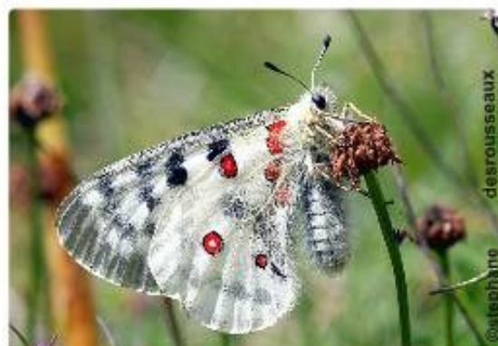
Appolon - Parnasius Apollo -

L'appolon vit à plus de 1000m d'altitude et vole dans les prairies de fin juin à mi août pour se poser de préférence sur les centaurees, les chardons ou scabieuses. Sa chenille se nourrit des feuilles d'orpin blanc qui pousse sur la rocaille.