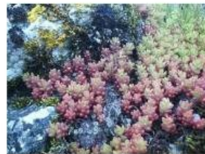
Orpin blanc - Sedum album