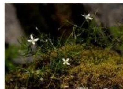
Moehringie fausse mousse

Vous évoluez maintenant sous couvert végétal, une forêt de hêtres a bravé le chaos de rochers et s'est implantée là dans la pente. Sous couvert végétal le sol est humide et une plante se développe qui forme des coussins assez denses : la moehringie fausse mousse. Elle se reconnaît très facilement à ses longues feuilles très étroites et ses petites fleurs blanches à quatre pétales.