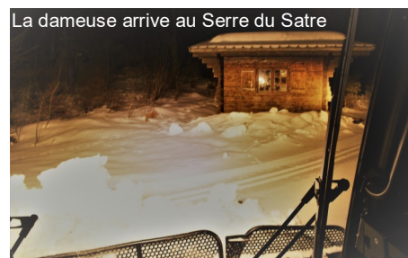
La dameuse arrive au Serre du Satre