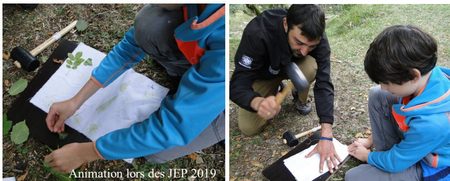
Animation lors des JEP 2019

Le plan de gestion 2016 - 2025 de l'ENS approuvé par le Département de l'Isère définit et planifie des actions qui doivent être mises en œuvre par la commune. Lors des séances du 20 janvier et du 17 février, le Conseil a approuvé les devis qui concernent les actions suivantes :