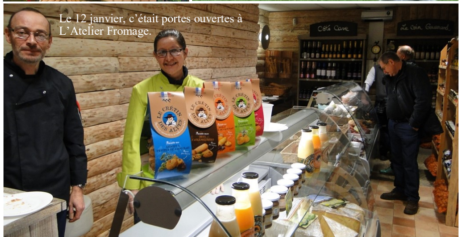
Le 12 janvier, c'était portes ouvertes à L'Atelier Fromage.