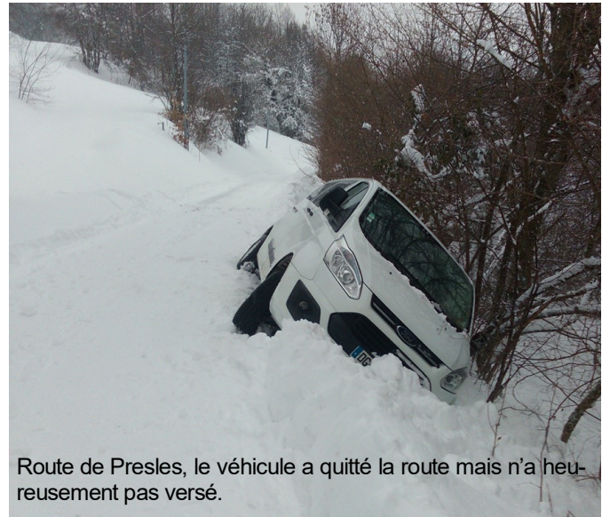
Route de Presles, le véhicule a quitté la route mais n'a heureusement pas versé.

Avec les vacances d'hiver, le soleil est revenu. Place aux joies de la neige !