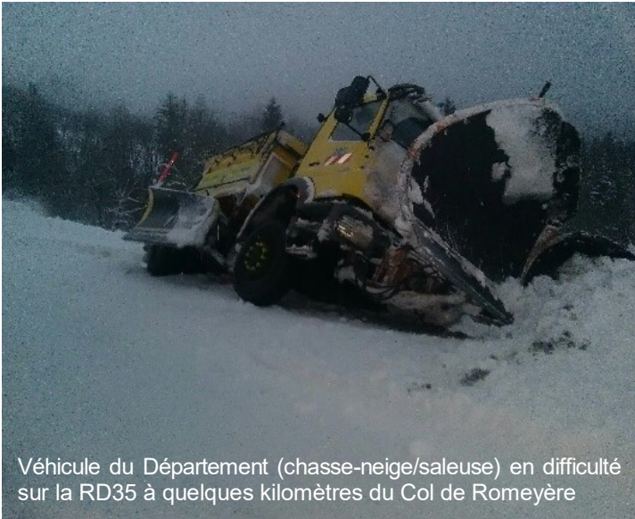
Véhicule du Département (chasse-neige/saleuse) en difficulté sur la RD35 à quelques kilomètres du Col de Romeyère

Au Col, des vacanciers en séjour à Cœur des Montagnes ou dans les gîtes ont eu la sagesse de différer leur départ du dimanche soir au lundi matin.