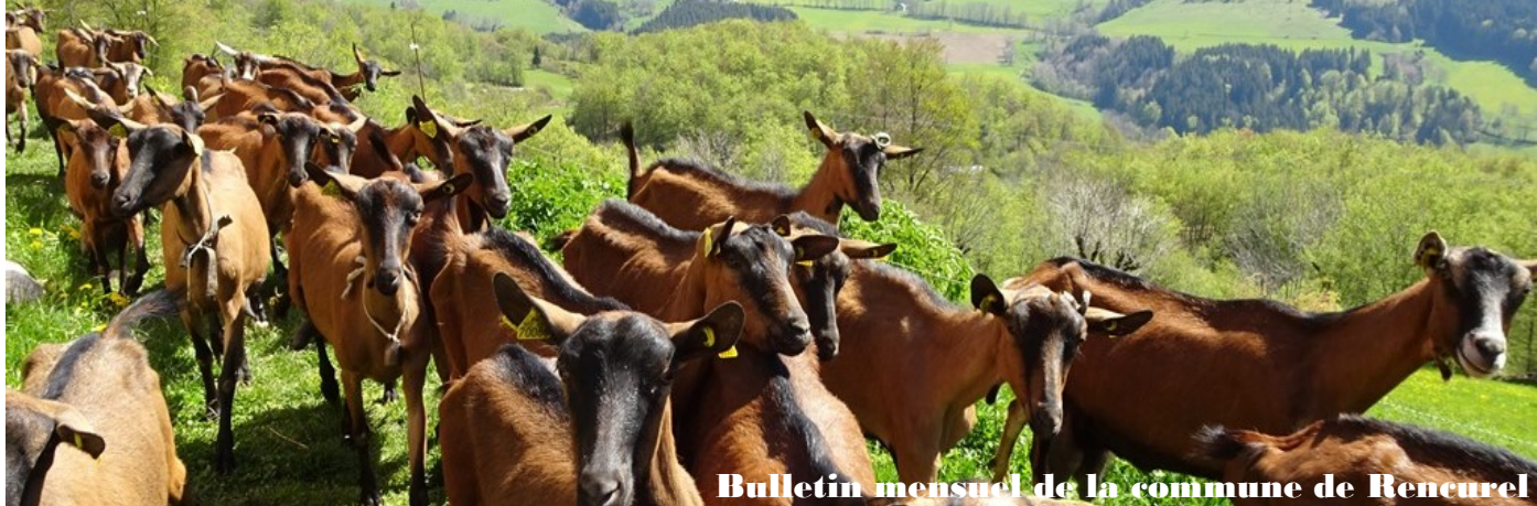
Bulletin mensuel de la commune de Rencurel