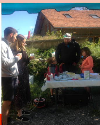
Le Sou des écoles

La première matinée a été un grand succès. L'argent récolté servira à aider les écoles à financer les projets de l'année prochaine.